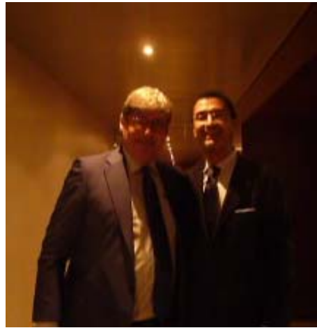
Paolo Del Debbio – Rete 4