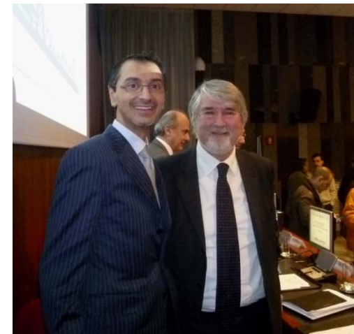
Ministro del Lavoro – Giuliano Poletti