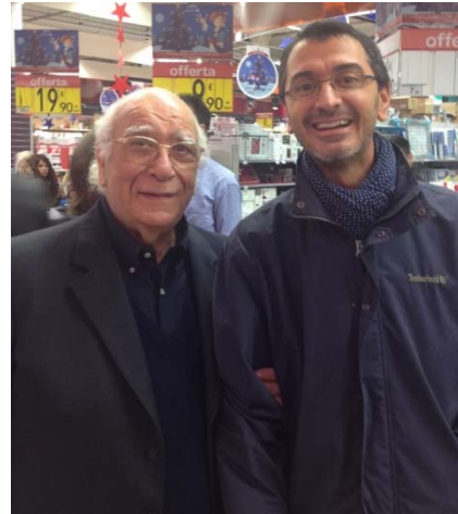
Giovanni Rana – Pastificio Rana