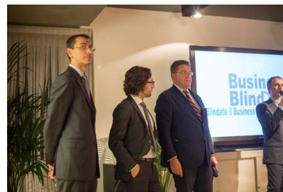
Incontro tra Imprenditori e vari consolati nell'occasione del Business Blind Date – MILANO Esposizione delle opportunità in Repubblica Dominicana