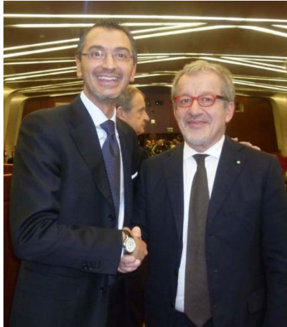
Presidente Reg. Lombardia : Roberto Maroni