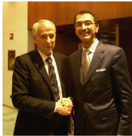
Sindaco di Milano Giuliano Pisapia