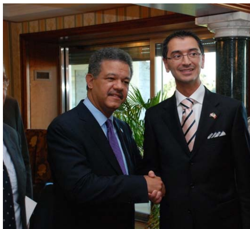
Ex Presidente : Repubblica Dominicana : Leonel Fernández ROMA